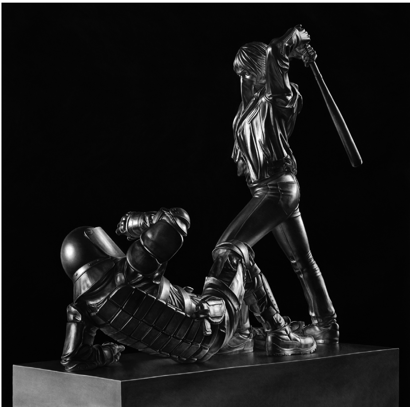
Model for statue 3 (silver) - 2022 195x200cm Carbón comprimido sobre papel Compressed charcoal on paper Price: 17.000 EUR