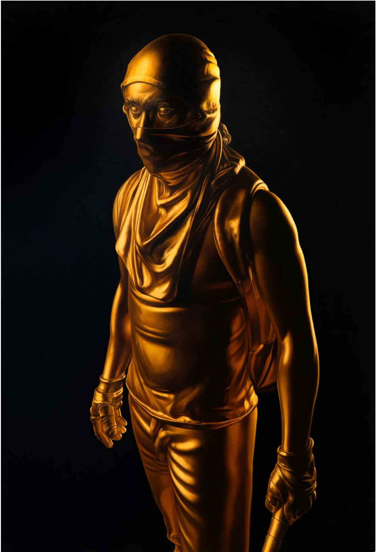
Model for statue 2 (gold) - 2022 146x100cm Óleo sobre lienzo Oil on canvas Price: 8.750 EUR