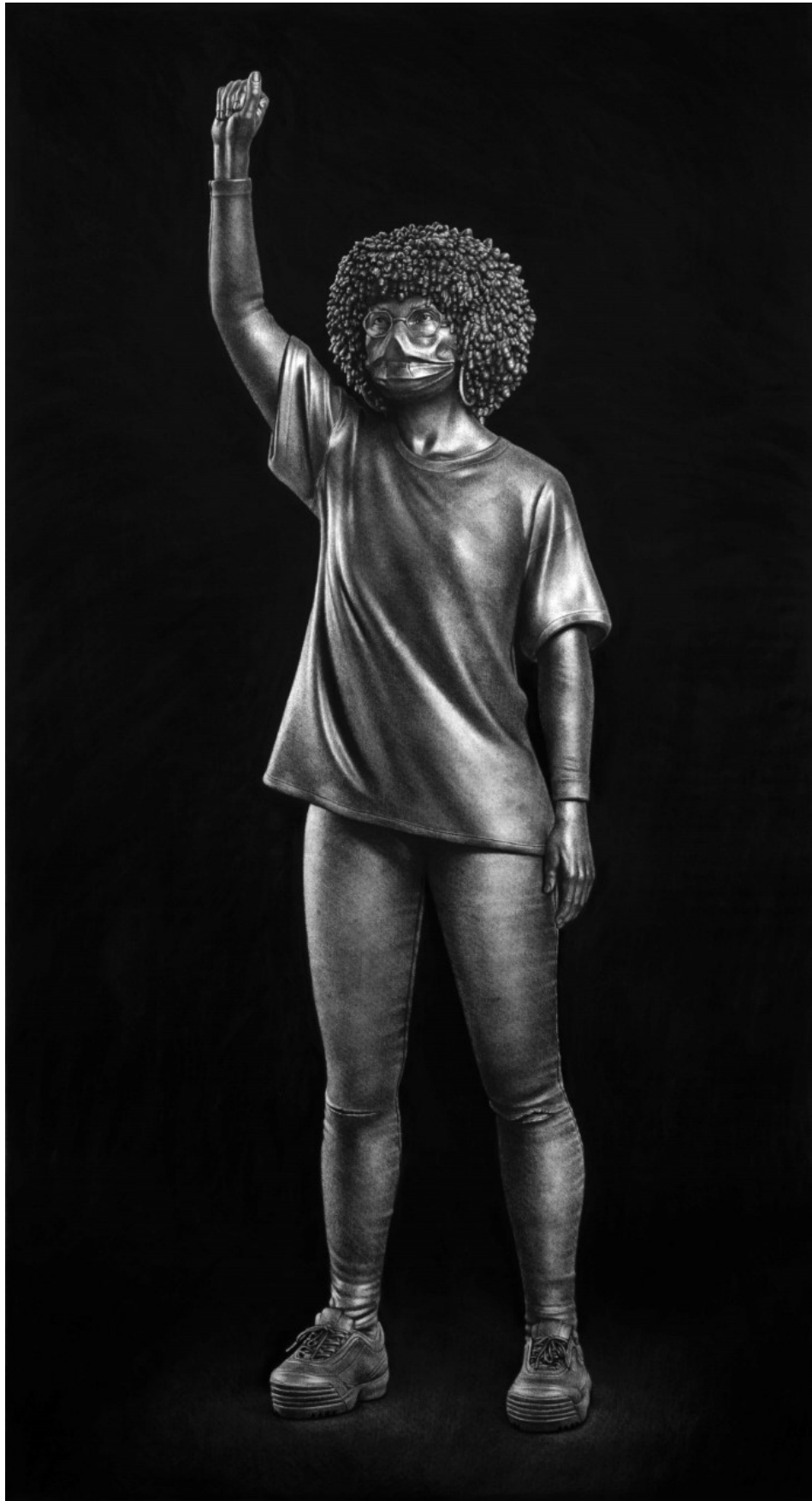
Model for statue 1 (aluminium) - 2021 200x110cm Carbón comprimido sobre papel - enmarcado Compressed charcoal on paper - framed Price: 9900 EUR