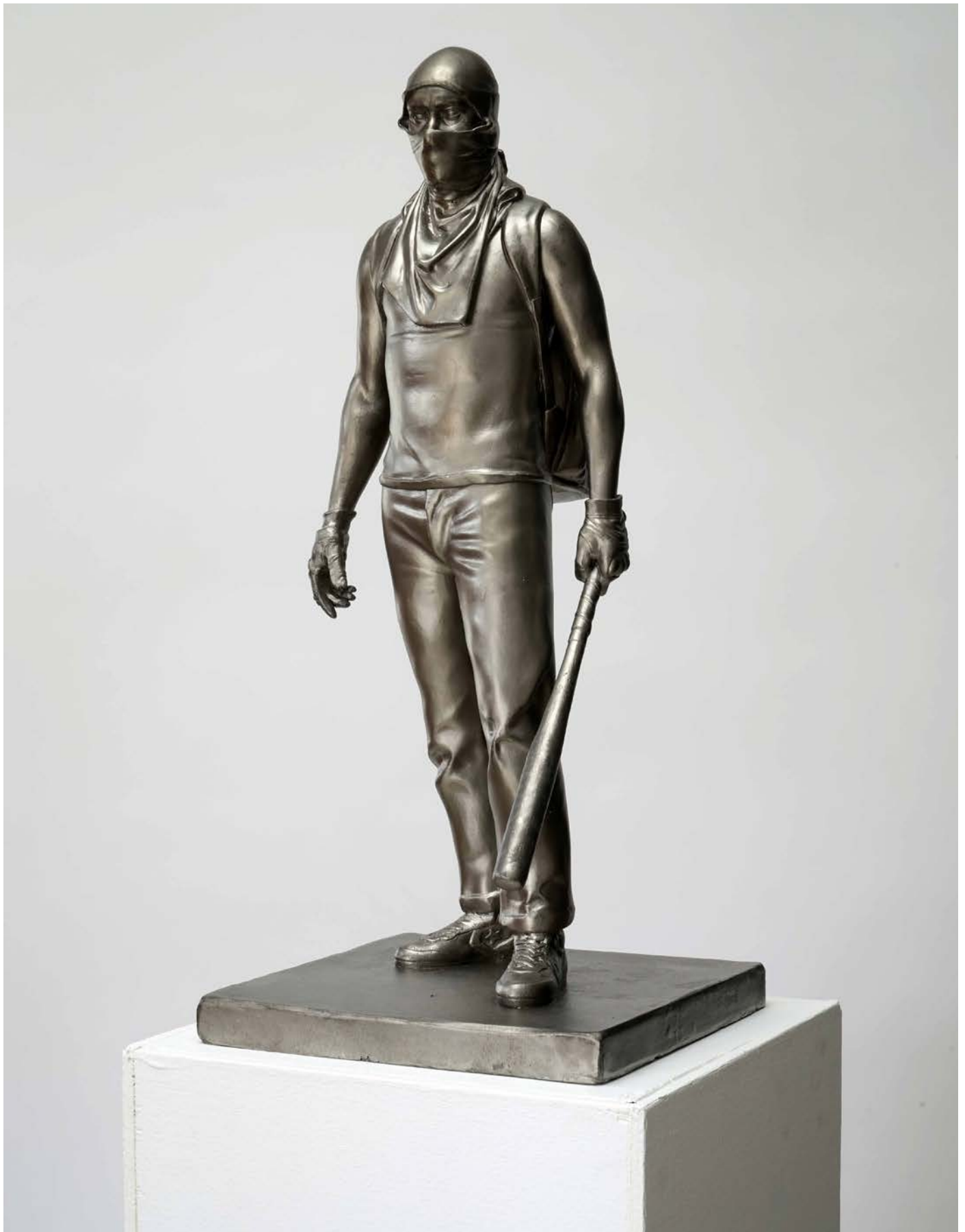
Model for statue 2 - 2022 60x25x25 cm Acero inoxidable Stainless steel Edition of 6 + AP Price: 8.500 EUR