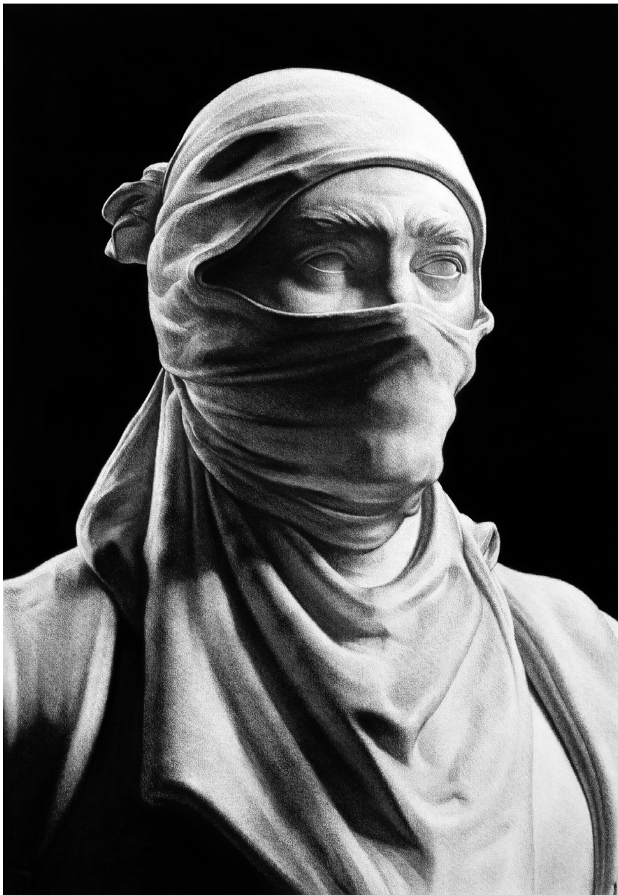
Model for statue 2 (detail) - 2022 100x70cm Carbón comprimido sobre papel Compressed charcoal on paper Price: 4.750 EUR