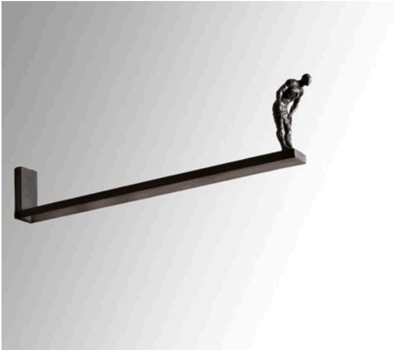
“DESDE ARRIBA”.Serie 1/15 unidades. Bronce y hierro. 100 x 26,5 x 12 cms