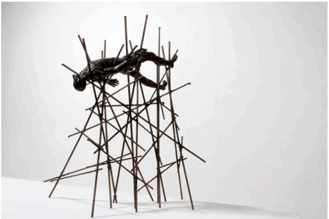
ENTREPALOS - Pieza única - Bronce y hierro - 47 x 55 x 32 cm.

Galería Victor Lope Arte Contemporaneo C/ Aribau 75, 08036, Barcelona www.victorlope.com info@victorlope.com tel. (34) 936675559