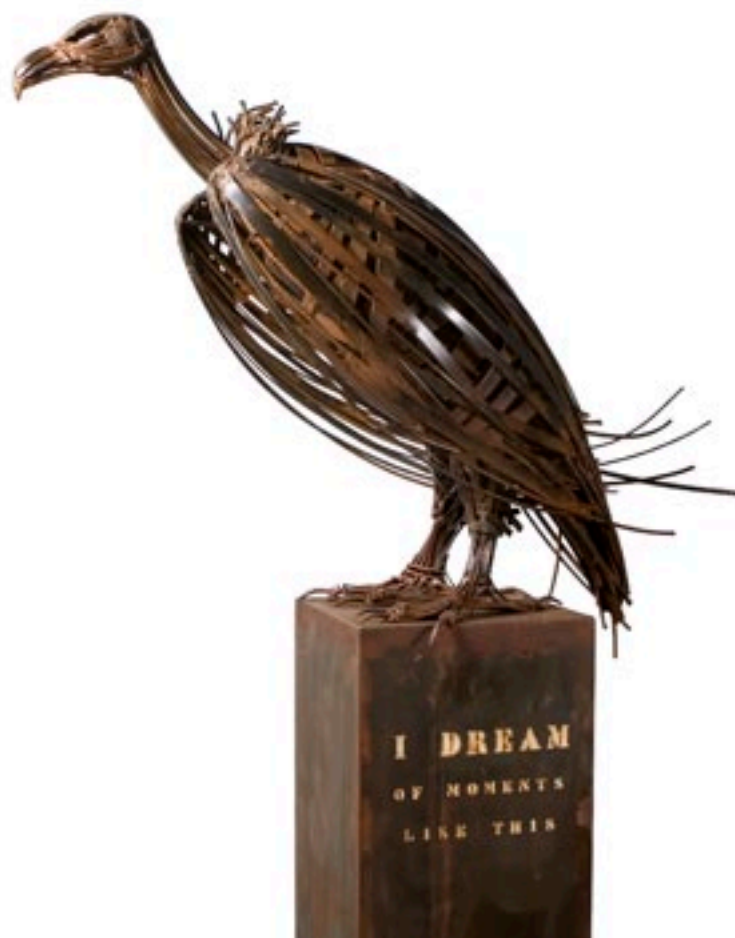
"I DREAM". Pieza única. Acero corten y hierro. 196 x 105 x 45 cm