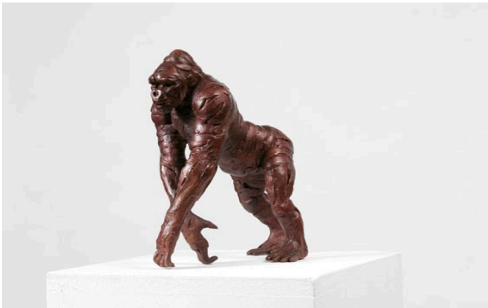
“SILVERBACK I”.Serie 1/15 unidades. Bronce. 25 x 23 x 13,5 cm.