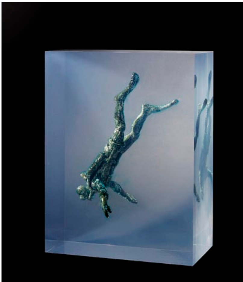
“SUMERGE”. Obra original 1/7 unidades. Bronce y resina. 27 x 20 x 12 cm.