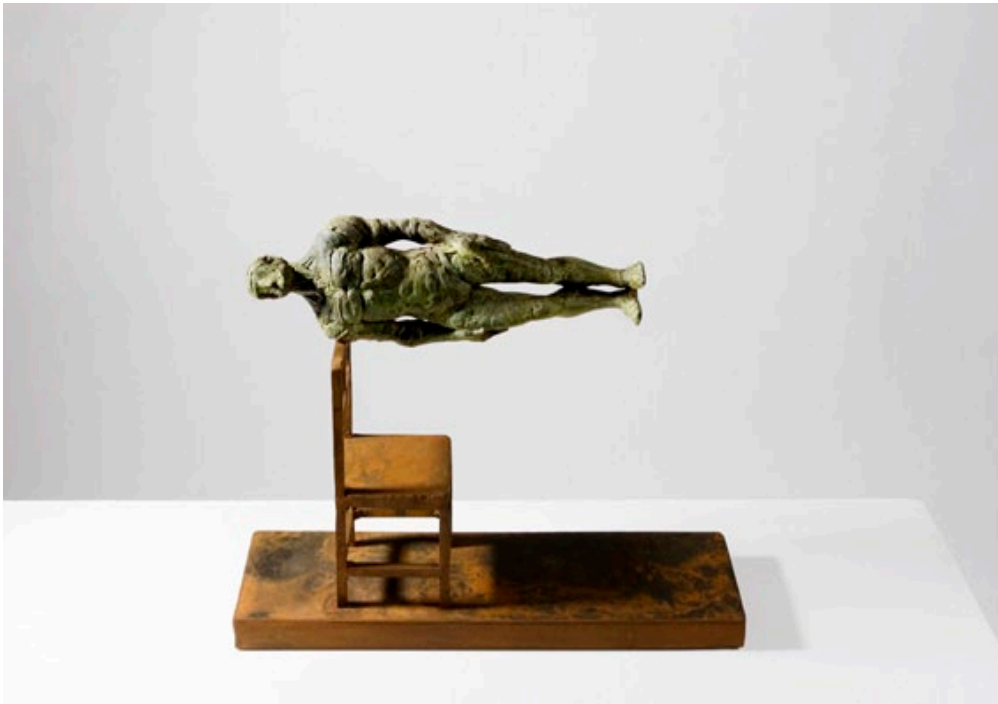
“MAGIA”.Obra original 1/7 unidades. Bronce y hierro. 50 x 39 x 15 cms