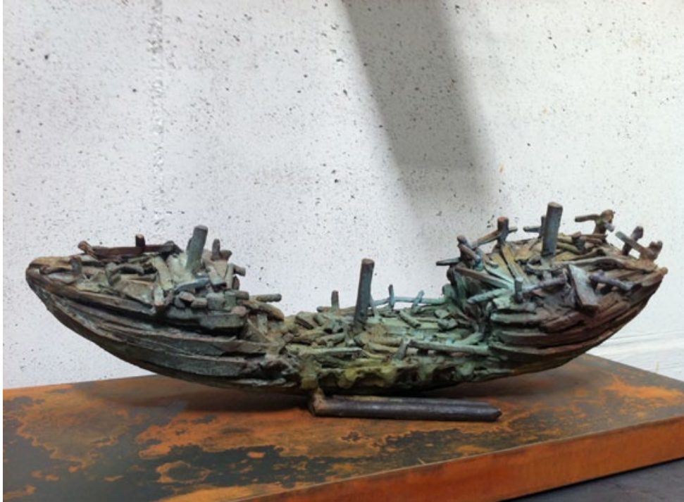
“GALEÓN”. Serie 2/15 unidades. Bronce y hierro. 50 x 22 x 14 cm.