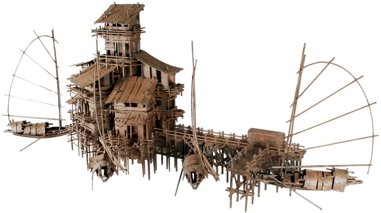
ALDEAS FLOTANTES VI - Pieza única - acero corten y hierro - 175 x 75 x 55 cm.