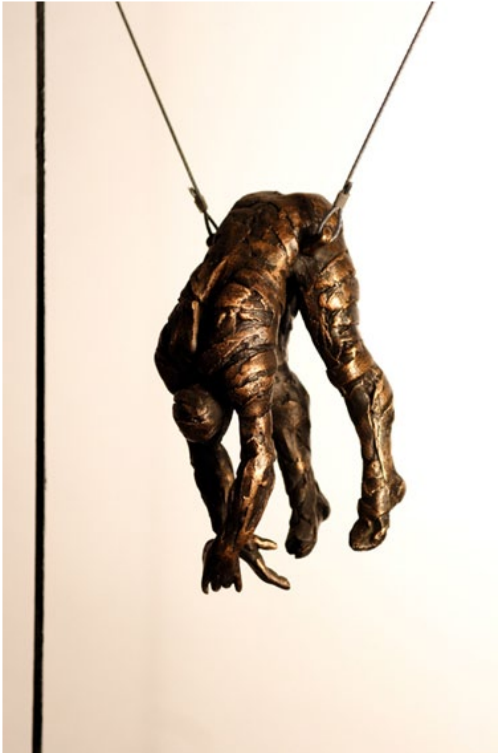
“HOMBRE-HUECO II”. Serie 9/15 unidades. Bronce y hierro. 20 x 9 x 9 cm. Pieza. // 80 x 26,5 x 26,5 cm. Estructura.