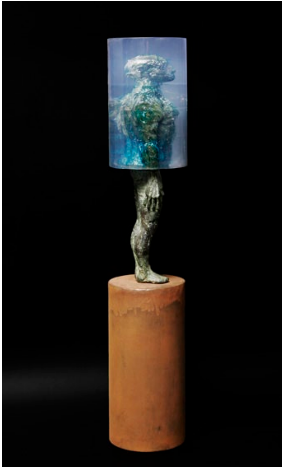
"CILÍNDRICA". Pieza original 1/7 unidades. Bronce, hierro y resina. 64,5 x 12 x 12 cms.