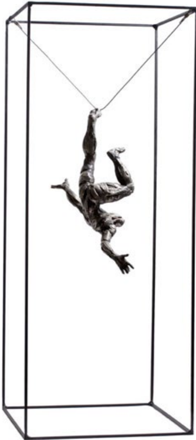
GRAVEDAD III “.Serie 5/15 unidades. Bronce, plata y hierro. 31 x 24 x 14 cm. Pieza. // 80 x 32 x 32 cm. Estructura