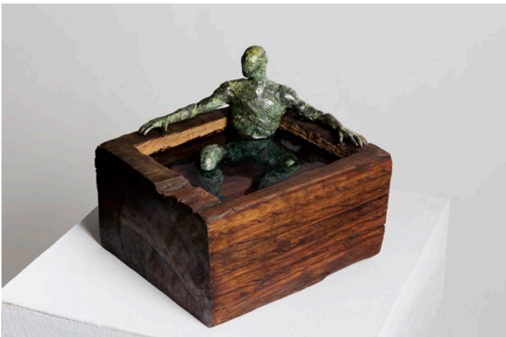
“BAÑERA V”.Original .1/7 Bronce, madera y resina / 24 x 22 x 21 cm