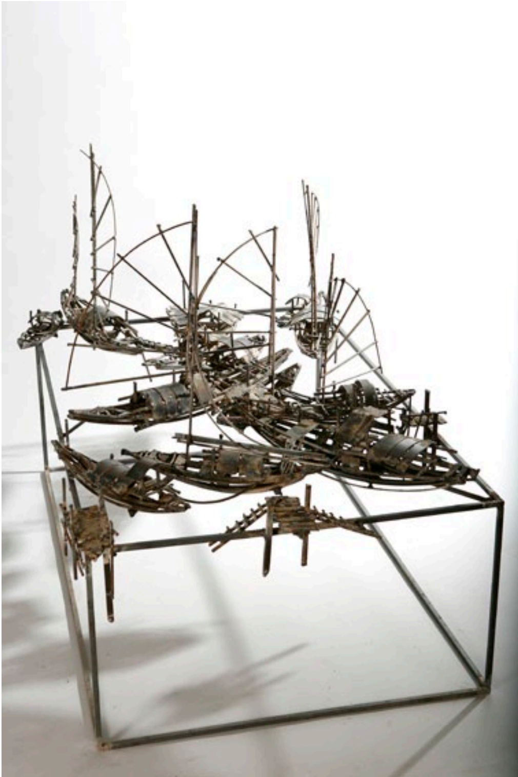
“MERCADO FLUVIAL”. Pieza única. Hierro. 140 x 88 x 81 cm.