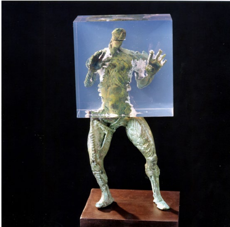
“OCLUSIÓN PARCIAL”. Original 4/7 unidades. Bronce y resina. 52 x 22 x 17 cm