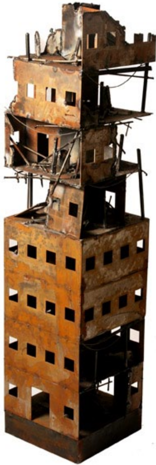
“EN DESTRUCCIÓN”.Pieza única. Hierro. 170 x 40 x 40 cm